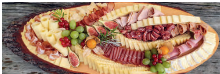
Für Geniesser ein echtes Highlight auf dem Gabentisch!

Langentannen 1, 6374 Buochs Telefon 041 620 21 82 bergkaeserei-langentannen.ch