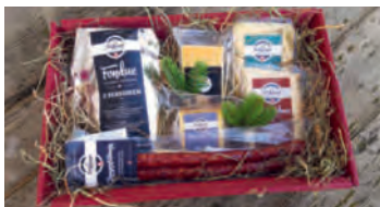
Ein Geschenkkorb der Käserei Langentannen vereint Vielfalt und Genuss.