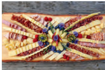
Diese kleinen und grösseren Kunstwerke werden mit grosser Sorgfalt zusammengestellt.