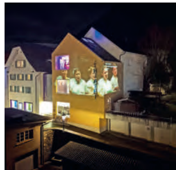
Theater an der Mürg