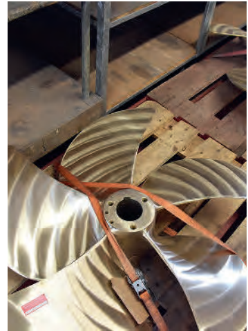
Propeller eines Kursschiffs