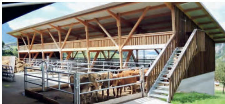
Moderner Laufstall mit einzigartiger Besuchergalerie