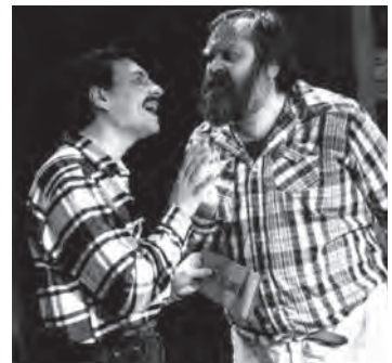
«Volpone» von Stefan Zweig (1994)