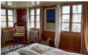
Gemütlichkeit mit Ausblick