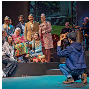
«Richtfest» von Sarah Nemitz und Lutz Hübner (2024)