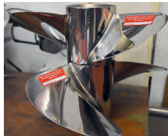
Glanzstück für unter Wasser