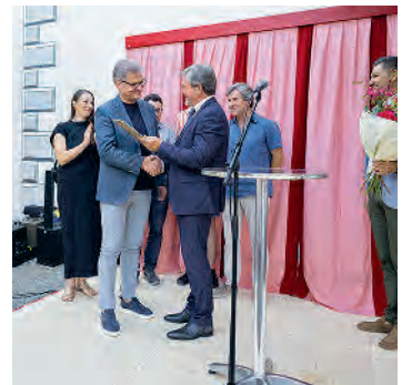
Kulturpreisverleihung im Winkelriedhaus