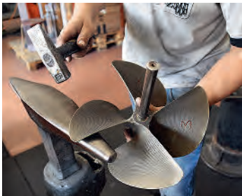
Exakte Mass- und Handarbeit