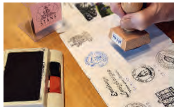
Stempel muss sein