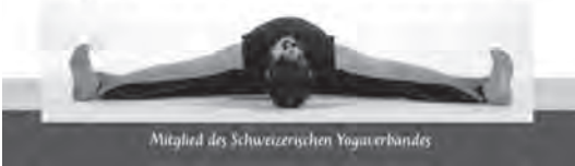
Mitglied des Schweizerischen Yogaverbandes

Ich freue mich auf Ihre Kontaktaufnahme.