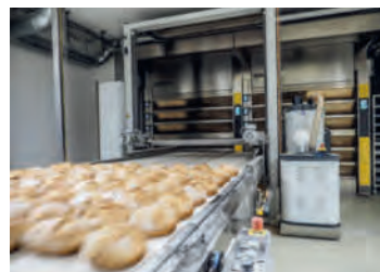
Herrlich knusprig und frisch