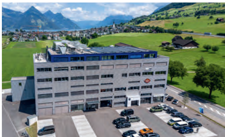
Produktionsstandort mit Postkartenidylle