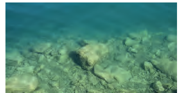
Einstieg in die faszinierende Unterwasserwelt