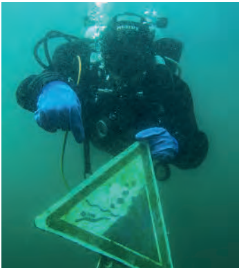
Achtung Steinschlag!

Das Seegras wiegt sich sanft im Rhythmus des Vierwaldstättersees, Kaulquappen flitzen lustig umher, Eglis verstecken sich heimlich zwischen Blättern und Ästen, manchmal auch ein Hecht; und Muscheln verschliessen sich schnell bei Annäherung, während man wie schwerelos in die immer dunkler werdende Tiefe hinabsinkt,