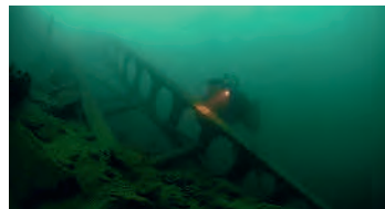
Reste der versunkenen Förderanlage vom Bau des Seelisbergtunnels