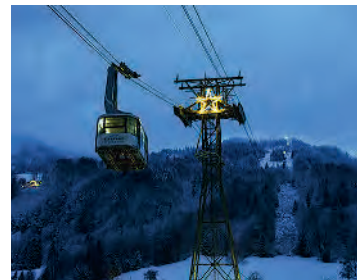
Weisst Du, wie viel Sternlein stehen ...