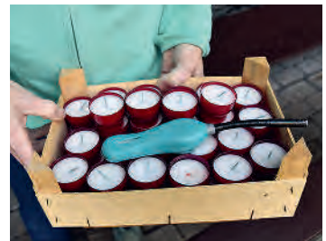
Kerzen zum Gedenken