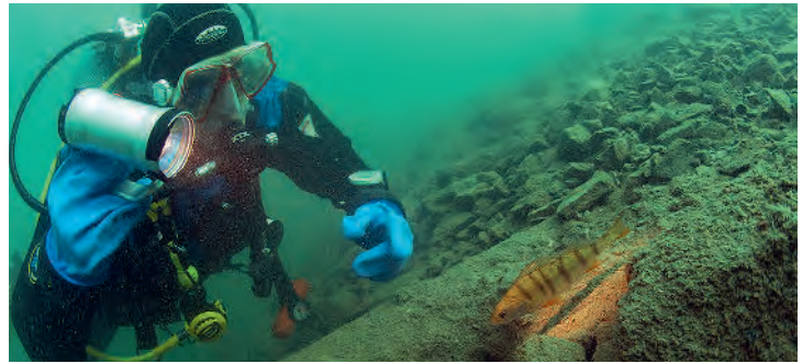
Unterwasserbegegnung mit einem Egli