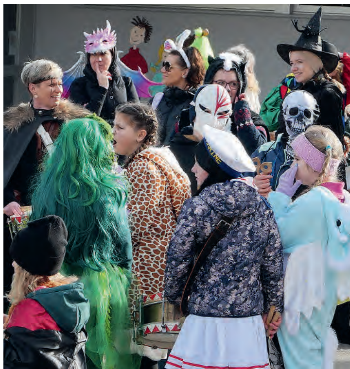
Für die Kinder bietet der Umzug an der Schulfaschnacht die erste Gelegenheit aktiv mit der Fasnacht in Berührung zu kommen.