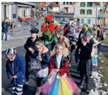
Der Umzug vereint die Fasnächtler aller Generationen zu einem gemeinsamen Erlebnis.