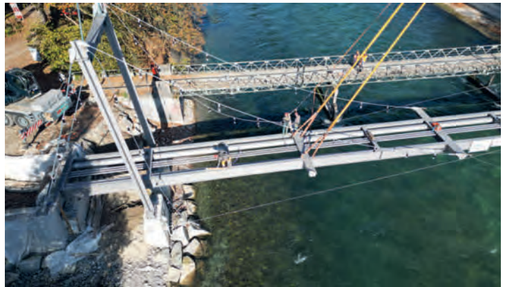
Ersatz Aare-Brücke bei Münsingen Belp

Kernserstrasse 47 CH-6372 Ennetmoos www.hr-durrer.ch info@hr-durrer.ch