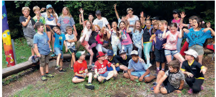
Grosse Begeisterung bei der Jugendriege

Auf der Website www.tv-ennetmoos.ch sind alle Informationen ersichtlich.