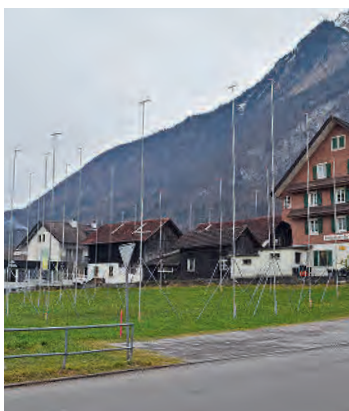
In St. Jakob soll die Mehrgenerationen Überbauung entstehen