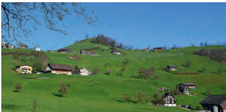
Auf Unter Rotzberg werden Kastanienhaine gepflanzt