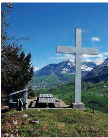
Aussicht vom Mueterschwandenberg