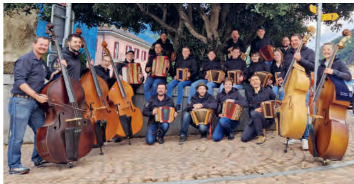
Der Volksmusikverein Ennetmoos am Eidgenössischen Volksmusikfest in Bellinzona.