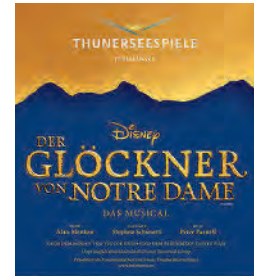
Der Glöckner von Notre Dame Musicalerlebnis auf der Seebühne Thun

Mit dem Car ab Nidwalden und Obwalden GRATIS PARKPLÄTZE IN KRIENS