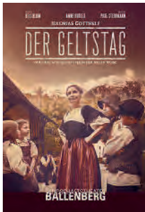
Der Geltstag Freilicht-Tellspiele Ballenberg

SICHERE DIR JETZT DEIN TICKET! www.heggli.com