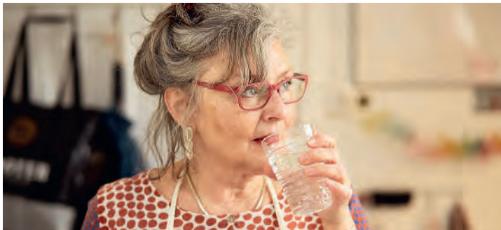
Inbesondere ältere Menschen sollten auf ausreichendes Trinken achten, da sie Durstgefühl weniger stark empfinden

Weitere Tipps und Informationen erhalten Sie in der Apotheke bzw. Drogerie und auf der Website des BAG unter www.bag.admin.ch/bag/de/home/gesund-leben/umwelt-und-gesundheit/hitze.html . Kommen Sie kühl durch den Sommer!