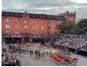
Basel Tattoo Musik-Spektakel in Basel

Sternmatt 4 | 6010 Kriens | Tel. 041 318 31 31 | E-Mail: car@heggli.com