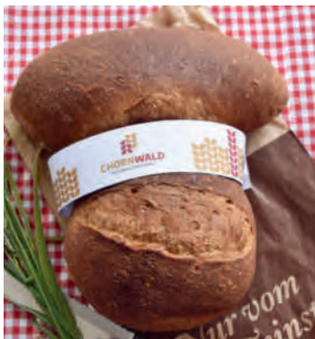
Gesund. Nahrhaft. Von hier.