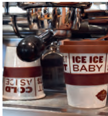
Trendy (für) unterwegs