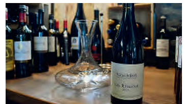
Weingenuss in Perfektion