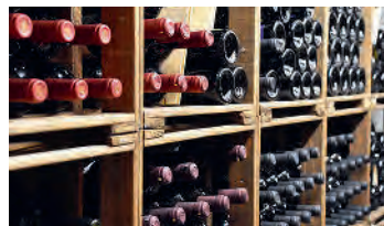
Kühl und dunkel