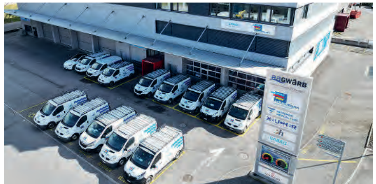
Der Firmensitz in Oberdorf/NW