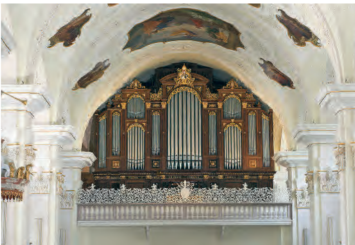
Der Orgelprospekt verrät nur in kleinen Ansätzen, welch monumentales Meisterwerk der Orgelbaukunst sich hinter dieser Fassade versteckt.

Bilder und Texte Dorfgeschichten: Beat Christen