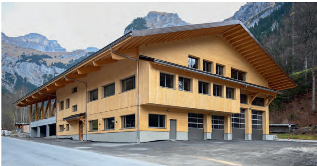
Viel Holz. Das für den neuen Forstwerkhof der Bürgergemeinde in Engelberg verarbeitete Holz stammt zu 87 Prozent aus Schweizer Wäldern.