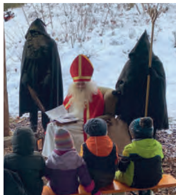
Samichlaus auf dem Waldfestplatz