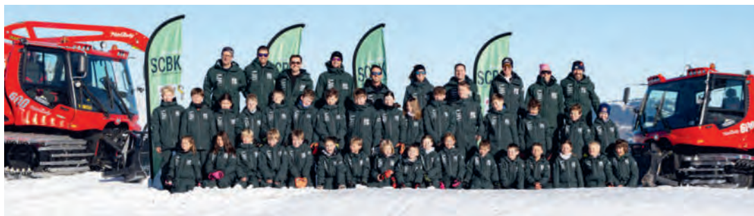
Sie alle träumen von einer Skikarriere.

Dem SCBK herzlichen Glückwunsch und noch viele weitere, erfolgreiche Vereinsjahre.