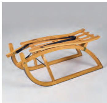
Das Original des «Beggrieder Schlittä»

Was eine wunderbare Überleitung zu unserem nächsten Beitrag liefert, nämlich den über den Skiclub Beckenried Klewenalp.