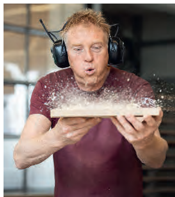
Schlittenbau mit Liebe, Leidenschaft und Hingabe