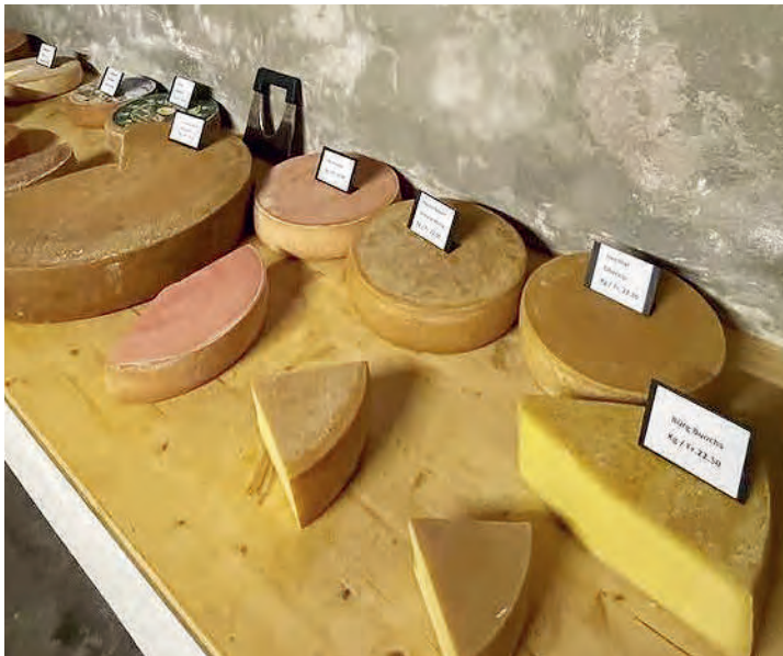
Grosse Auswahl im Chäslädeli

Gutscheine bitte bis 31.12.2026 einlösen.