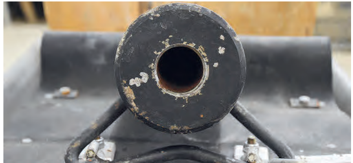
Bereit für den Abschuss