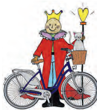
Illustration: Hannah Kemke