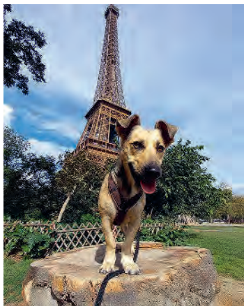
Sightseeing für vier Pfoten.