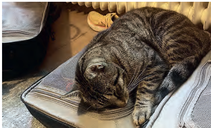
Kater Simba kommt schon mal mit.