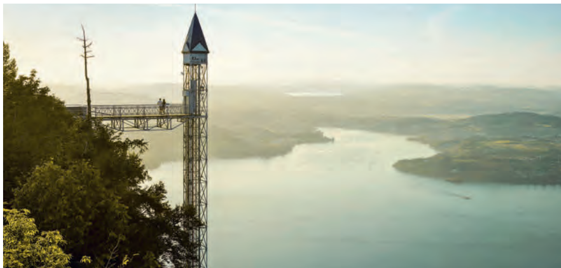
Ausflug mit dem Lucerne Travel Pass zum Hammetschwandlift mit Aussicht auf den Vierwaldstättersee