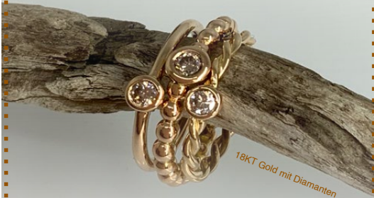
18KT Gold mit Diamanten