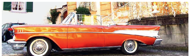
Chevrolet Bel-Air 1957