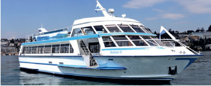
Fahrgastschiff der SNG