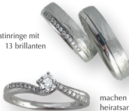
platinringe mit 13 brillanten