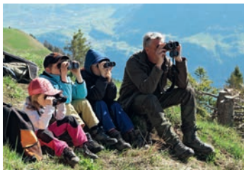
Die Beobachtung der Birkhahn-Balz begeistert Gross und Klein.