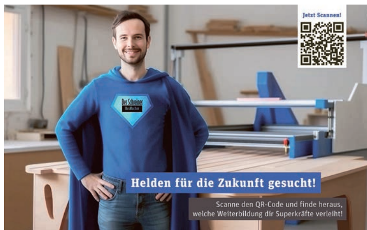
Die HFB beschreitet mit der Kampagne neue Wege, um die junge Zielgruppe zu erreichen.