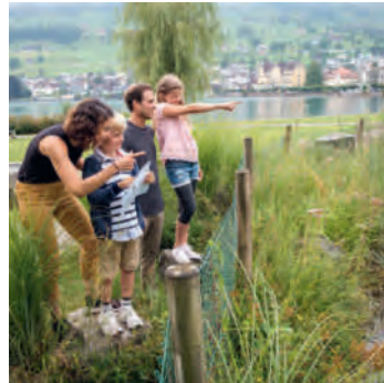
In der Umgebung vor Ort sind Hinweise versteckt.

Restaurant «Der Italiener» / Hotel Rigiblick am See, Seeplatz 3, Buochs (ganzjährig) oder TCS Camping, Seefeld 4, 6374 Buochs (April bis Oktober) Tickets können auch online über den folgenden Link gekauft werden: www.detektiv-trails.ch