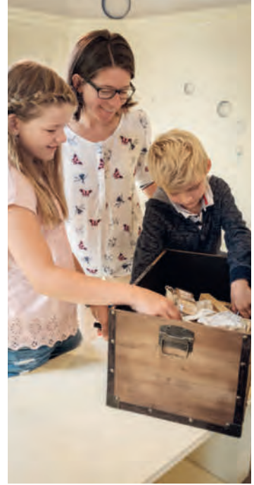
Am Schluss wartet ein Geschenk aus der Schatztruhe auf erfolgreiche Spürnasen.