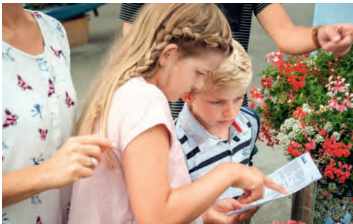
Mithilfe der Schatzkarte löst man die Rätsel.

Verein Tourismusregion Klewenalp-Vierwaldstättersee, 041 624 66 01 www.regionklewenalp.ch info@regionklewenalp.ch