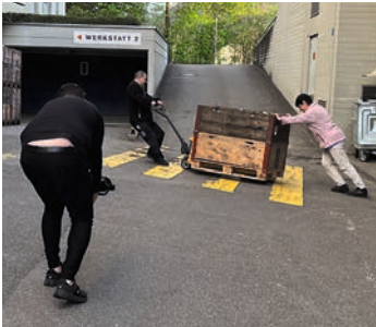
Der Boden vor der Spedition in der alten Werkstätte der Stiftung Weidli Stans ist schräg, alles rollt davon.