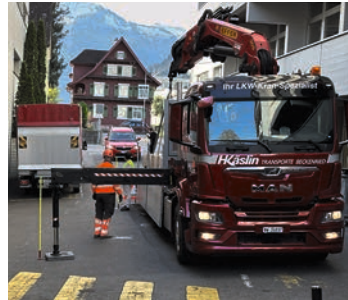
Gleichzeitig ist dies eine gefährliche Durchfahrtsstrasse, was das Be- und Entladen erschwert.