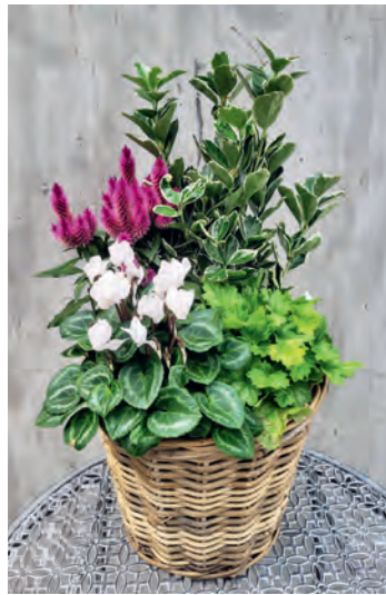
Stiller, geschmackvoller Gruss

Ab Mitte Oktober ist auch die Zeit, die Grabstelle winterfest zu machen und in ruhigem Stil zu bepflanzen, wie es der nun ebenfalls zur Ruhe kommenden Natur entspricht. Nach dem Jäten, Säubern, Bereinigen der Ränder und Zurückschneiden des Sommerflors werden winterharte, pflegeleichte Gewächse wie Erika, Besenheide und Skimmia mit ihren roten Beeren gepflanzt. Auf diese Weise ist das Grab auch im Winter gepflegt und zusammen mit gesetztem Efeu, Immergrün und Pachysandra ein farblich stimmiger, stets schön anzusehender Ort, der Trost spendet und den unsere Angehörigen verdient haben.