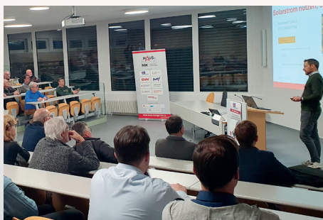
Fachvorträge 2024: Grosses Interesse