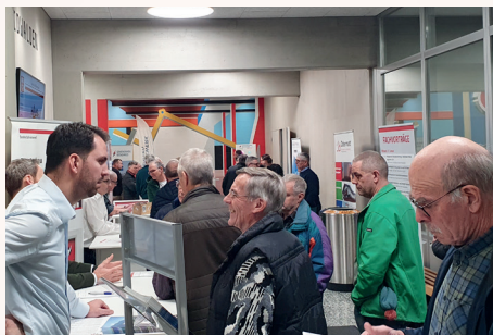
Beratungen aus erster Hand 2024